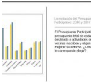
La evolución del Presupuesto Participativo: 2016 y 2017 El Presupuesto Participativo representa el 3% del presupuesto total de cada delegación, este es destinado a actividades en las cuales los vecinos y vecinas inscriben y eligen proyectos enfocados a mejorar su entorno. ¿Conoces el monto sobre el que te corresponde elegir?