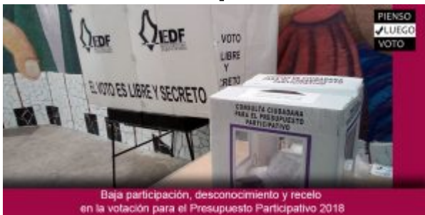
Baja participación, desconocimiento y recelo en la votación para el Presupuesto Participativo 2018

El pasado 3 de septiembre se efectuó la votación para elegir los proyectos ganadores del Presupuesto Participativo 2018 en la Ciudad de